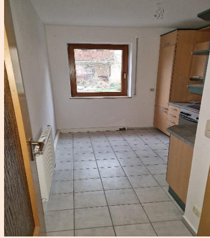
Küche, Blick vom Flur