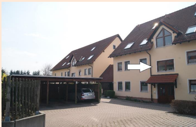
weitere Außenansichten, Wohnung siehe Pfeil