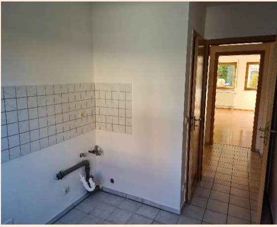
Küche, Blick über den Flur zum Wohnzimmer