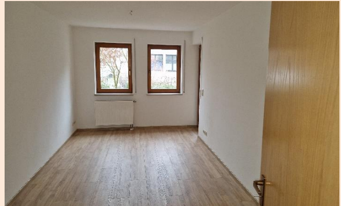
Sonniges Wohnzimmer, Tür Balkon hinten rechts