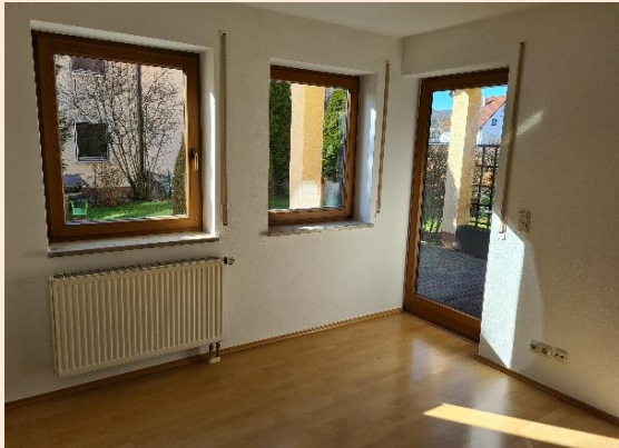
Wohnzimmer mit Tür zum Eckbalkon