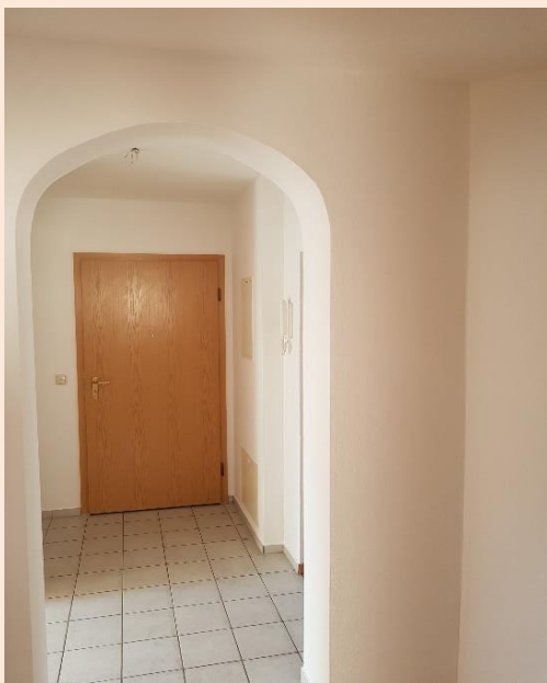
heller Flur, Blick zur Eingangstür