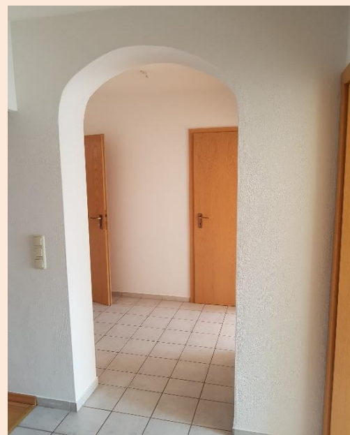
Flur Blick links Kinderzimmer gerade Badezimmer