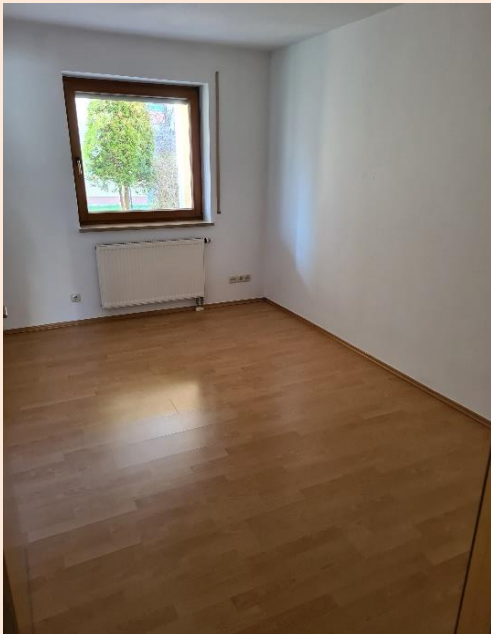
helles Kinderzimmer zum Balkon hin