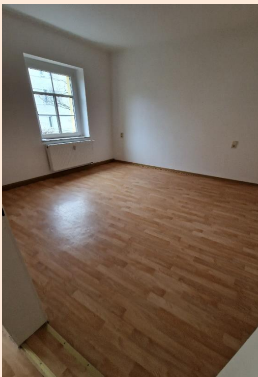
Kinderzimmer, Schlafzimmer nebeneinander