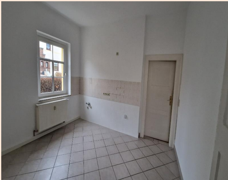
Küche mit Fliesenboden und Abstellraum