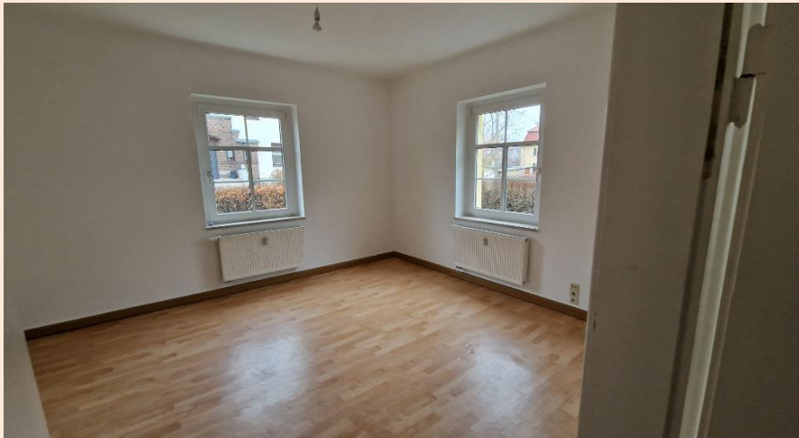
helles sonniges Wohnzimmer