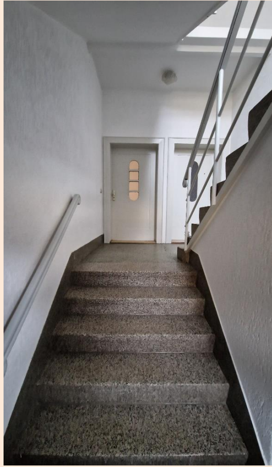
helles freundliches Treppenhaus