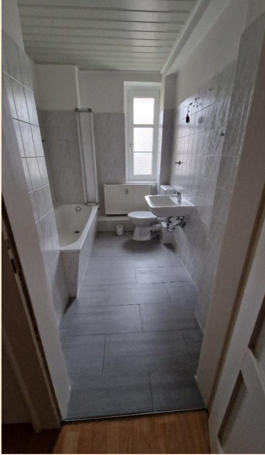
Bad mit Wanne, Fenster und WC