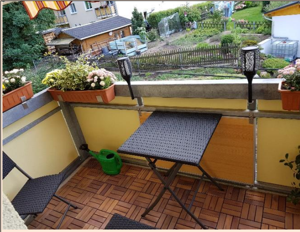
Balkon Blick zur Strasse