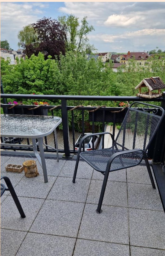
Balkon in ruhiger Lage