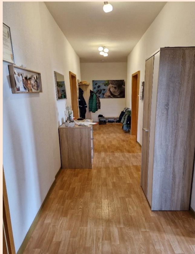
Flur, rechts Kinderzimmer, links Schlafz. Eltern