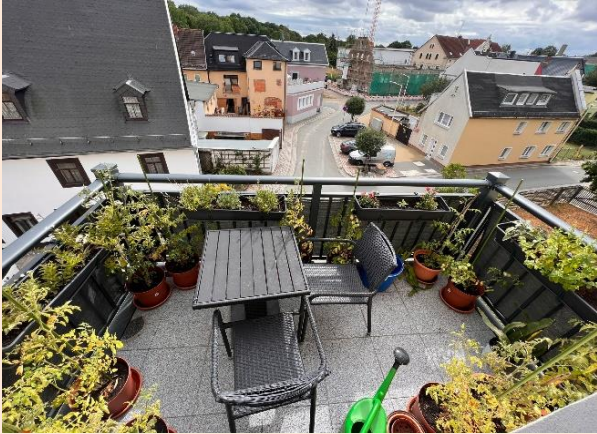
Balkon mit tollem Ausblick, ruhige Lage