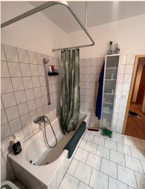
Bad mit Wanne und WC