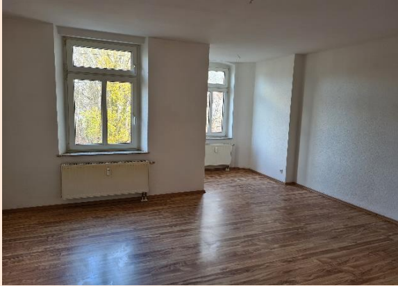
Wohnzimmer mit Erker und neuem Laminat