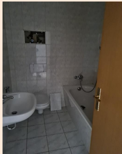
Bad mit WC und Wanne