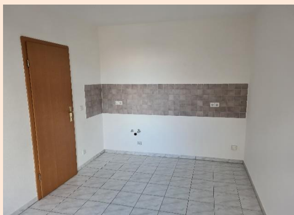
Küche mit Fliesenspiegel und Bodenfliesen