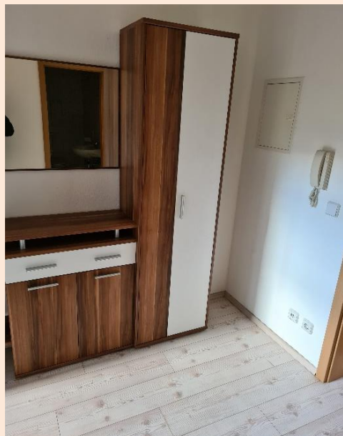
Flur mit Garderobe