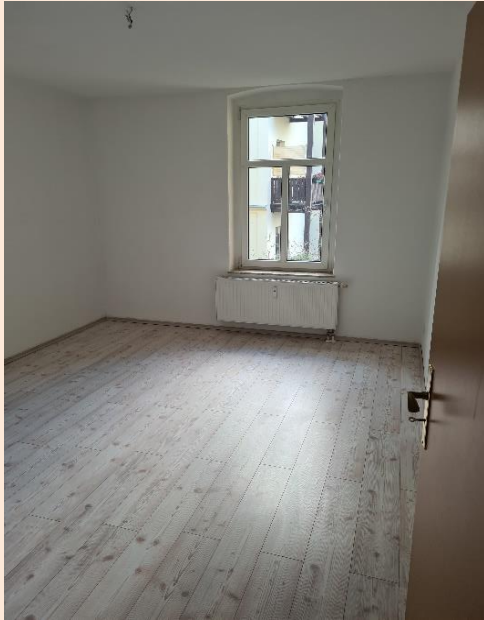
Schlafzimmer mit neuem Laminat zur Gartenseite