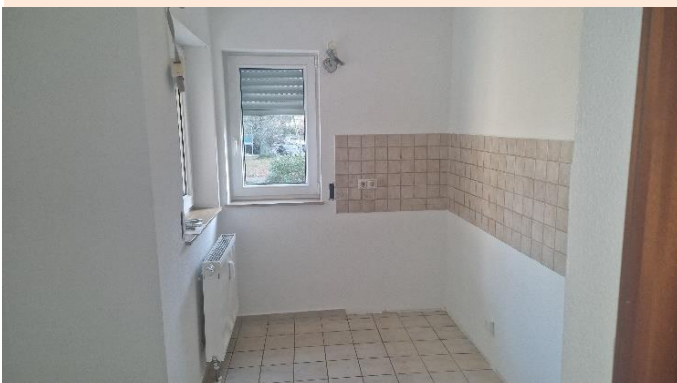
Küche mit zwei Fenstern.