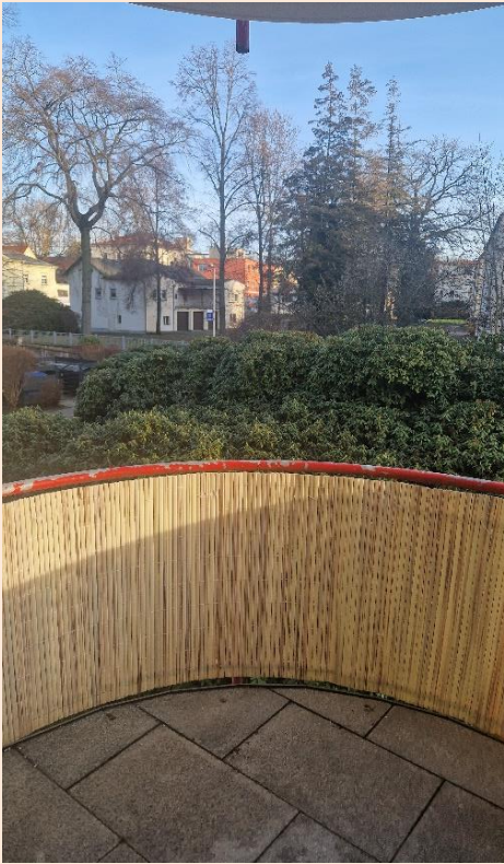
Blick vom Balkon