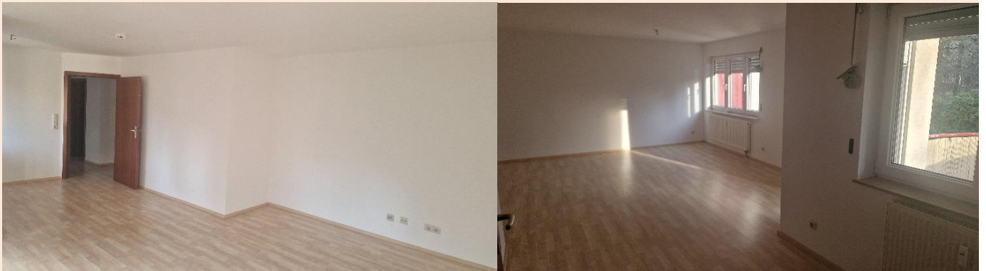
Großzügiges Wohnzimmer mit Sitzecke zum Balkon. Zugang Balkon.