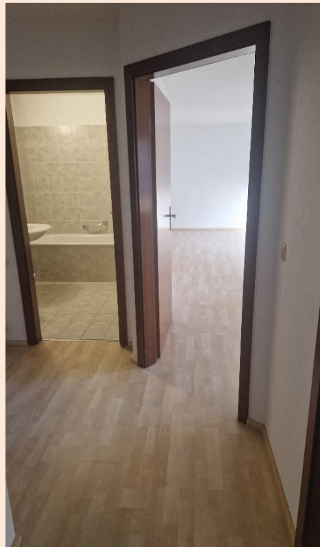
Blick vom Flur zum Bad mit Wanne