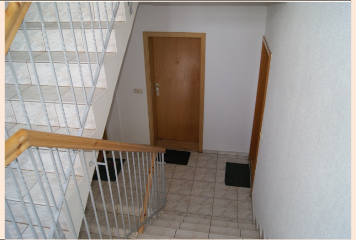
helles neu renoviertes Treppenhaus