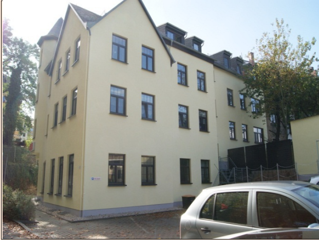
Rückansicht mit Stellplatz