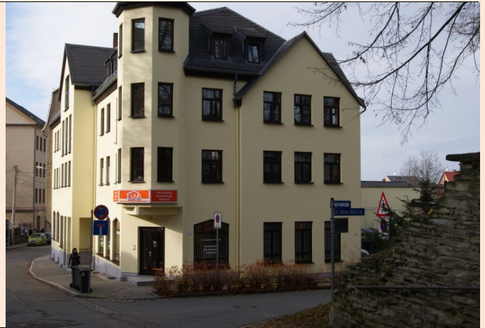
Straßenansicht mit großzügigem Eingangsbereich